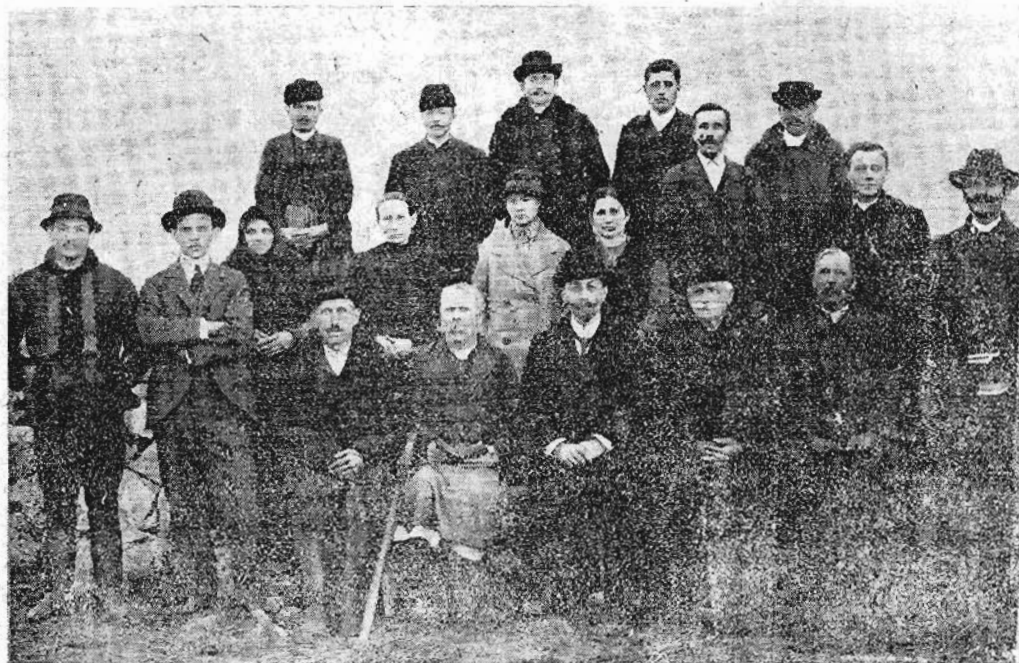
Evangéliumi munkások és vasárnapi iskolatanítók Nyiregyházán.

Csak későn, nagyon későn tértünk ez este