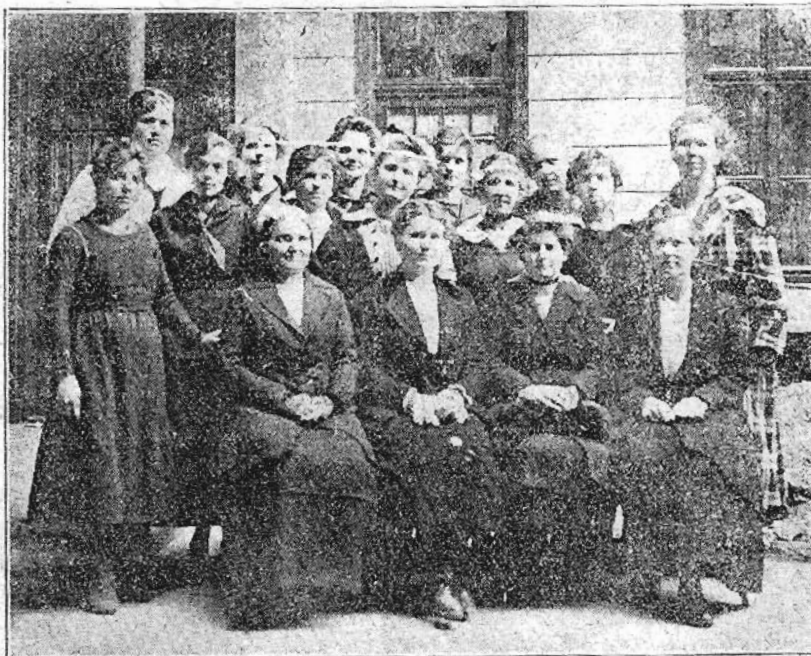
A budapesti német „Nőegylet”.