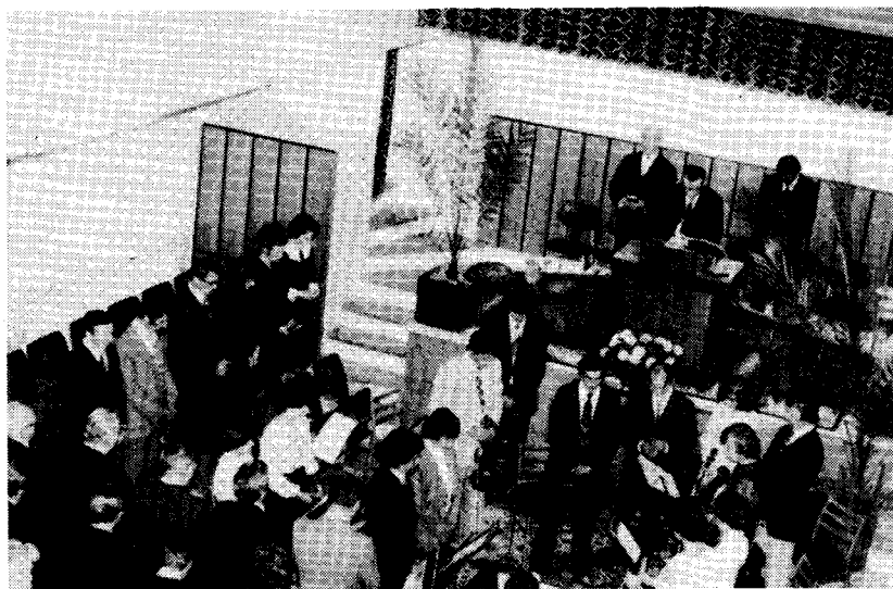
Tanévnyitó istentisztelet a Budapest, Székely Bertalan utcai adventista kápolnában