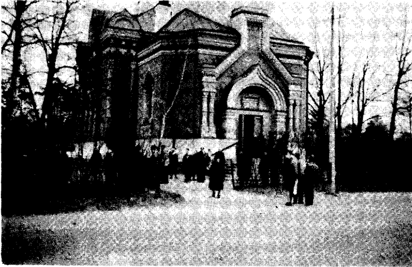
A leningrádi baptista gyülekezet imaháza