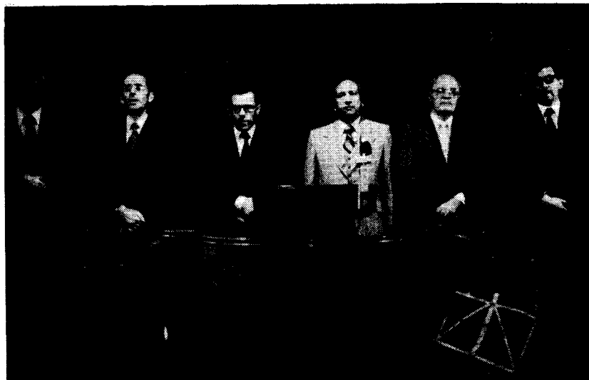
A Szabadegyházak Tanácsa Lelkészképző Intézetének tanévnyitóján részt vett O. Romo testvér is a Budapest, Nagy Ignác utcai adventista kápolnában