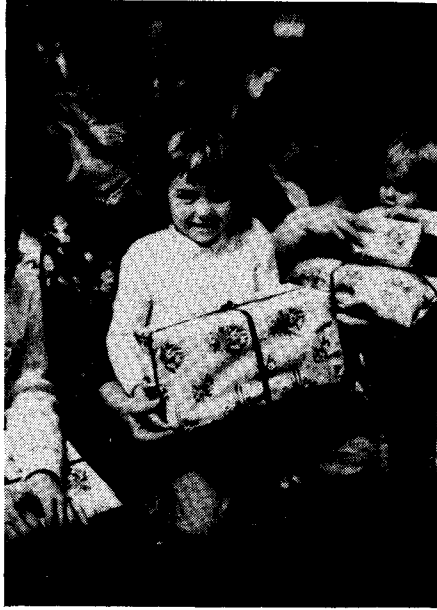
Családias karácsonyi ünnepély 1979-ben a Baptista Teológiai Szemináriumban